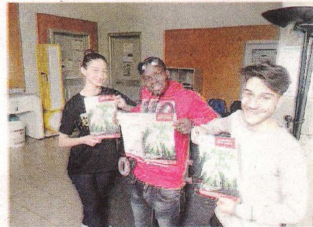
Festa del quartiere Libertà: qui accanto i ragazzi del Servizio civile

volontari del Servizio Civile e addetti all'infopoint - in alcuni momenti della settimana invece sono previsti