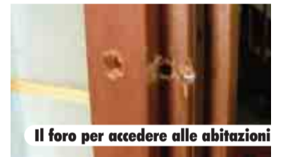
Il foro per accedere alle abitazioni