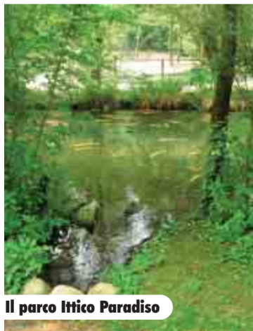
Il parco Ittico Paradiso

re una giornata all'aria aperta per osservare molto da vicino (sono presenti osservatori subacquei) i pesci d'acqua dolce più grandi d'Italia. Per rendere sempre più interessante e stimolante la visita, sono state introdotte alcune novità: grazie alla vasca sopraelevata, sarà possibile toccare direttamente con le